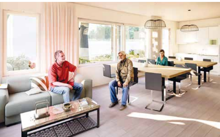
Raholan uudet kerhotilat tarjoavat asukkaille tilan yhteisölliseen tekemiseen ja mukavaan yhdessäoloon. Esteettömyys ja viihtyisyys ovat suunnittelun keskiössä.

– Nyt vain odotellaan, että Rahola valmistuu entistäkin parempana, Wallenius tiivistää.