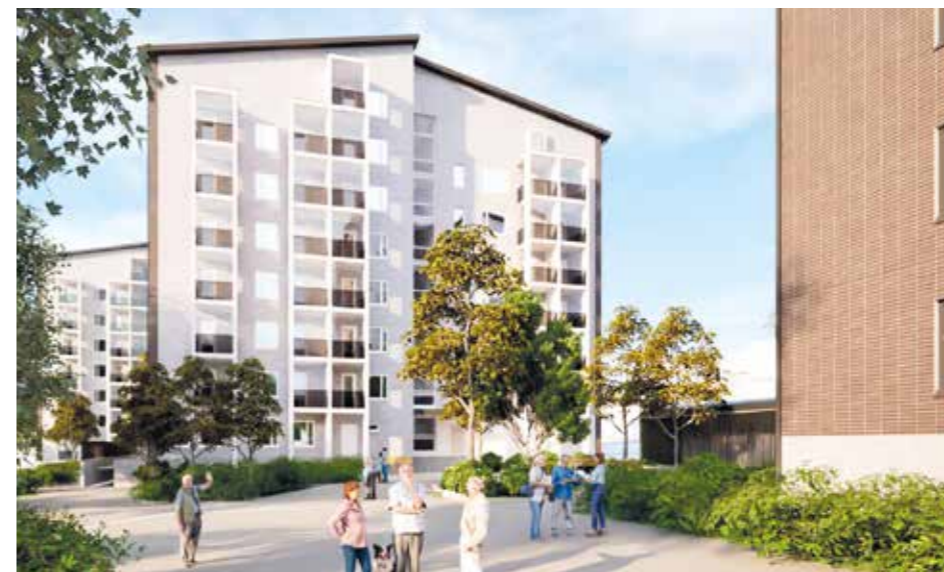
Uudistuvan Raholan kolme modernia kerrostaloa tarjoavat esteettömiä koteja ja viihtyisän pihapiirin asukkaille.