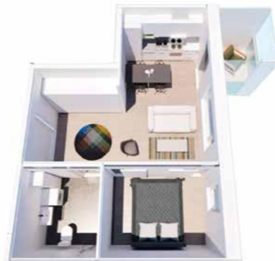
Pieni 2h+k, esimerkikaluutus 1: Pariskunnan koti