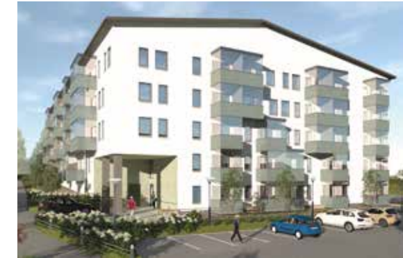
Pappilanrinteen ARA-rahoitteen uudiskohteen asuntohaku alkaa alkuvuodesta.

tälle alalle päädyin. Kuuntelin tarinoita työmailta ja seurasin muun muassa mökin rakentamista. Pappa osaa rakentaa ja minä pyrin kehittymään rakennuttajana, eli voitaneen sanoa, että samalla alalla ollaan.