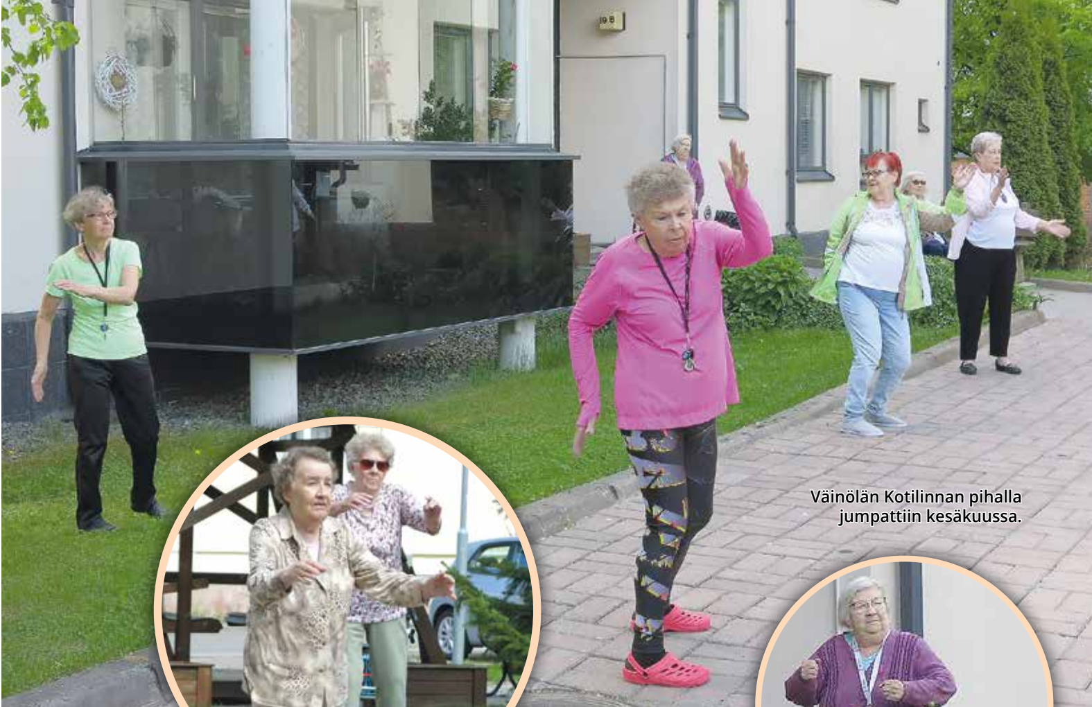
Väinölän Kotilinnan pihalla jumptattiin kesäkuussa.