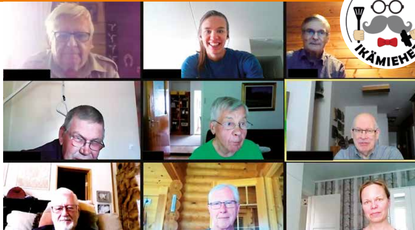
Etäyhteydet ovat olleet monelle ikämiehelle mielekäs tapa yhteydenpitoon.