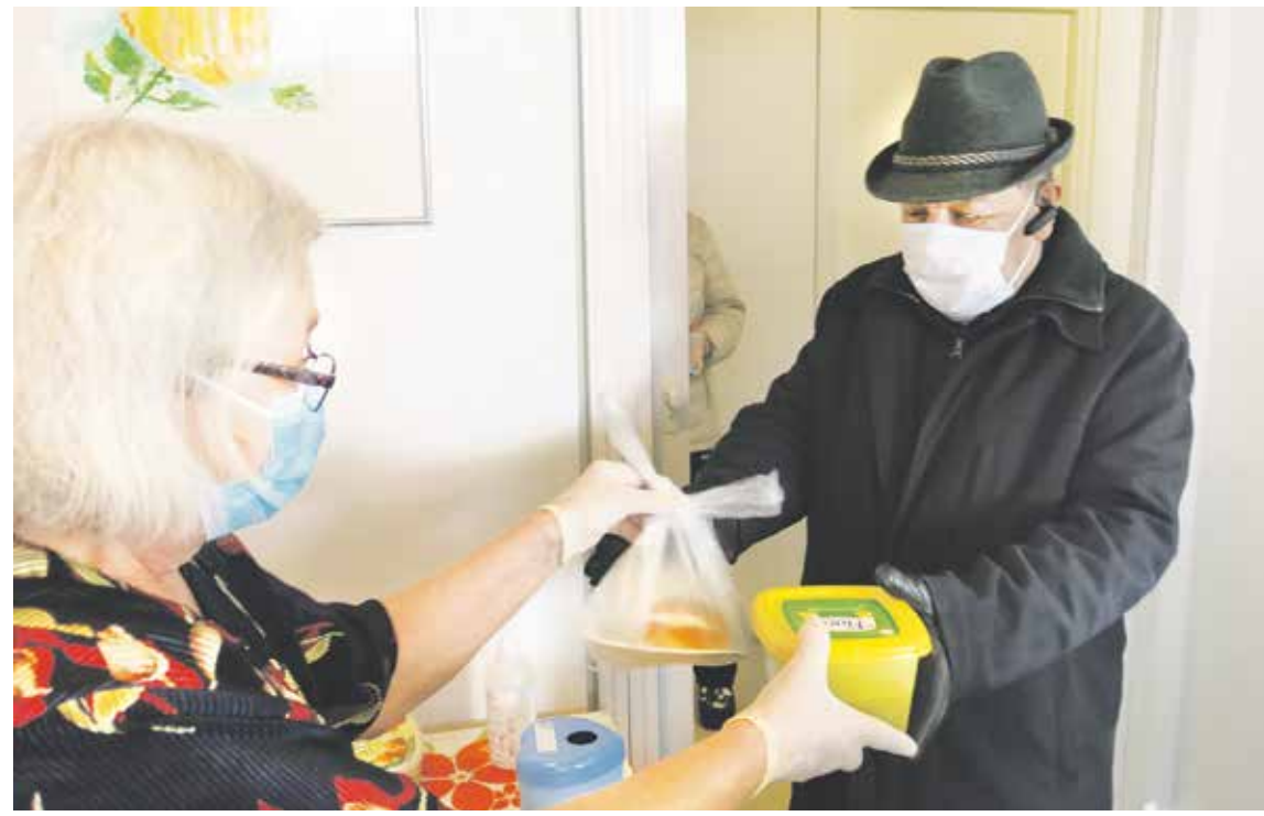
– Kyllä on hyvää palvelua, talon asukas kehuu.

– Tuulan ruuat ovat todella maukkaita, asukastoimikunnan jäsenet vakuutavat.