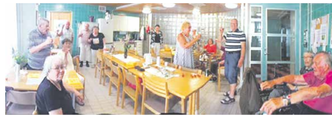
Vellamontupa on talon asukkaiden kohtaamispaikka, josta löytyy juttukumppaneita. Kuva on otettu 2019, nyt korona-aikaan koolla saa olla vain muutama asukas kerralla.

– Kesällä viihdyimme sisäpihan patiolla. Se on ollut erityisen tärkeä paikka koronarajoitusten aikana. Veimme kesällä penkit ulos ja järjestimme kaikki tilaisuudet