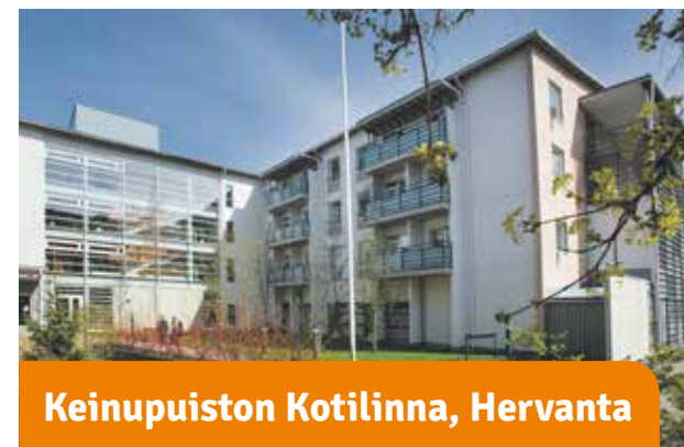
Keinupuiston Kotilinnat, Hervanta

Vieressä senioripuisto. Ulkoilmasta voi nauttia omalla lasitetulla parvekkeella ja lähistön lukuissa idyllisissä puistoissa. Samassa rakennuksessa toimii Nekalan palvelukeskus.