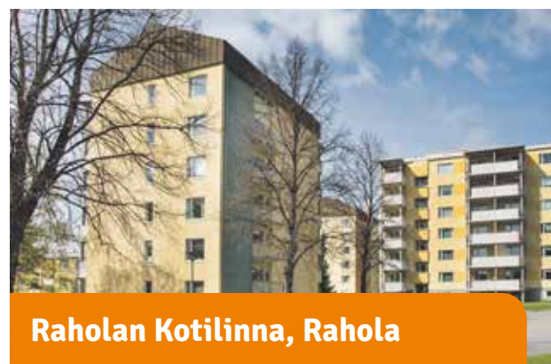
Raholan Kotilinnat, Rahola

Rivikoteja luonnossa. Lähellä Pispalinna talon hyviä palveluita ja Pyhäjärveä. Kodikkaassa talossa toimii myös lasten ryhmäpäiväkot.