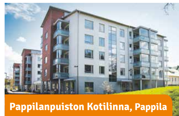
Pappilanpuiston Kotilinnat, Pappila

Keskeinen paikka. Nämä kaksi 4-kerroksista taloa ovat vain pallonheiton päässä Tammelan stadionilta. Asunnoissa on oma sauna ja lasitettu parveke.