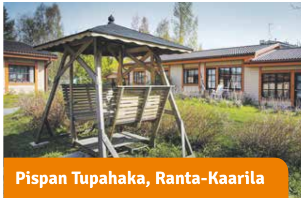
Pispän Tupahaka, Ranta-Kaarila

Vieressä päily Pyhäjärvi ja talon edestä löytyy bussipysäkki. Uudistuneessa talossa on palvelu- ja päiväkeskus sekä Tampereen Voimian ravintola.