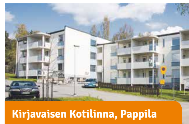
Kirjavaisen Kotilinnat, Pappila

Mukavaa arkea. Iso kerhohuone, yhteiset saunatilat ja pyykkitupa sekä viihtyisä oleskelugrillikatka tuovat arkeen monenlaista ajanvietettä. Ensimmäisen kerroksen asunnot ja yhteiset tilat ovat esteettömiä.