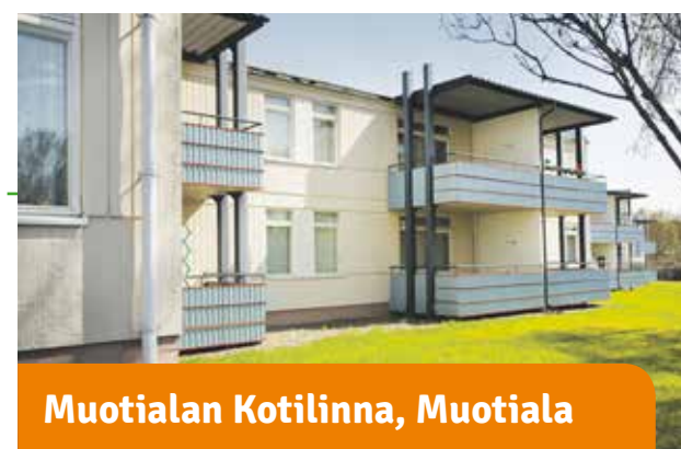
Muotialan Kotilinnat, Muotiala

Puisto ja parveke. Rauhallisen Raholan 6-kerroksisissa hissitiloissa on ulkoilureitit lähellä ja hyvät kulkuyhteydet.