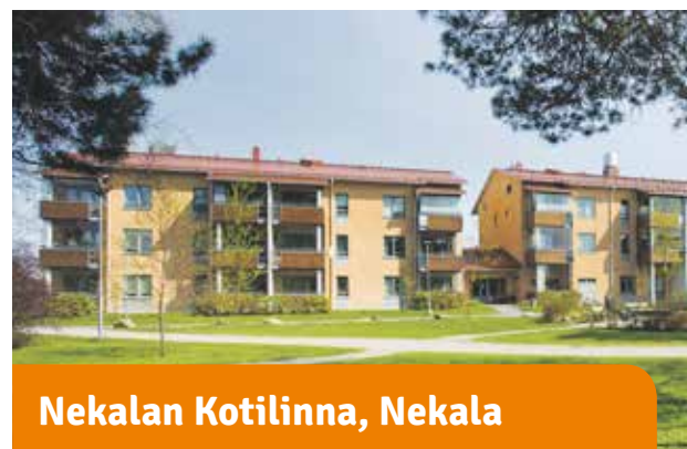
Nekalan Kotilinnat, Nekala

Ulkoilemaan ovelta. Koivistonkylän kaunis luonto ja kävelyreitit innostavat reippailuun. Peruskorjauksessa kaikki asunnot saavat oman lasitetun parvekkeen ja talosta tulee esteetön. Vieressä on Taatalan palvelukeskus.