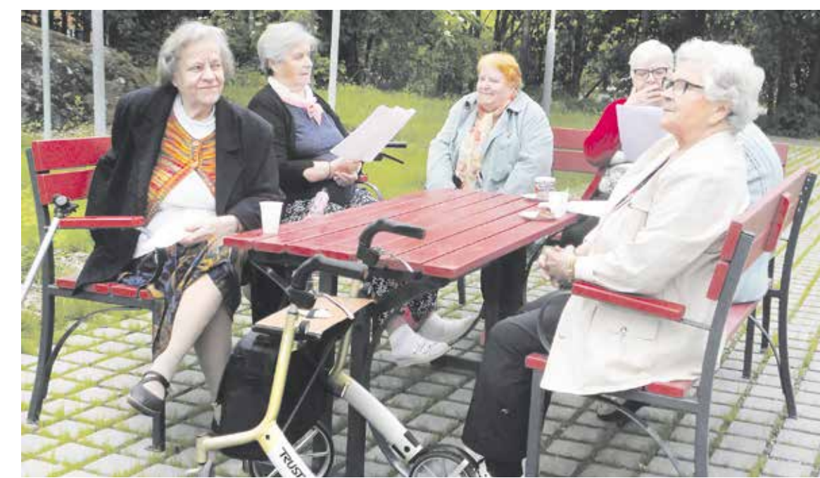
Sulkavuorella järjestettiin kesällä pihakonsertteja.

Koitti kevät 2020. Ehdimme järjestävää pihame Sinisessä huvimajassa makkarapais-