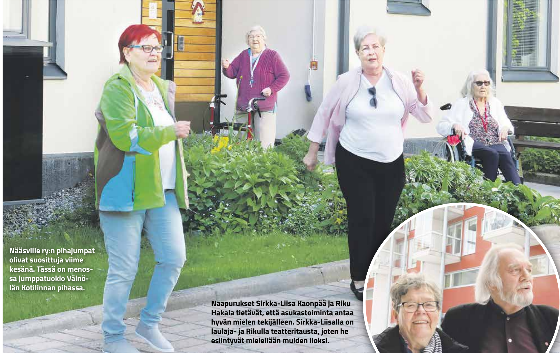
Nääsவில் ry:n pihajumppat olivat suosittuja viime kesänä. Tässä on menossa jumppatuokio Väinölän Kotilinnan pihassa.