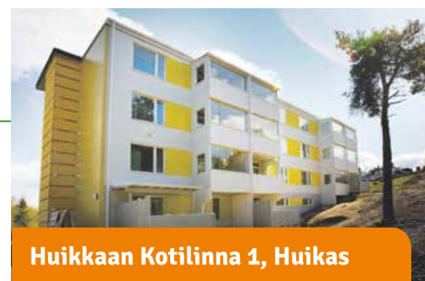
Huikkaan Kotilinnat 1, Huikas

Tilaa viihtyä. Muotiala on rauhallinen ja turvallinen asumisympäristö. Toisen talon pihalla on oma grillikatka ja toisessa kuntosali sekä neljä inva-asuntoa.