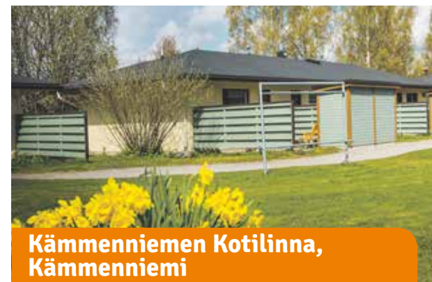
Kämmenniemen Kotilinnat, Kämmenniemi

Palveluita ja luontoa. Talon alakerrassa toimii kaupungin lähitori, ruokakauppa ja ravintola. Uimahalli on aivan nurkan takana. Suolijärven luontopolullekaan ei ole pitkä matka.