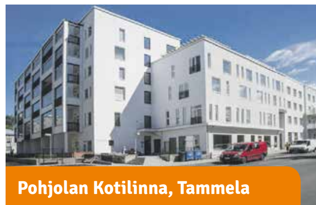
Pohjolan Kotilinnat, Tammela

Niihaman vieressä, lähellä Alasjärven uimarantaa. Aivan taloyhtiön edessä on bussipysäkki, josta pääsee sujuvasti TAYSiin ja keskustaan. Osa asunnoista on esteettömiä, osaan on muutama rappunen. Pihapiirissä toimii Pappilanpuiston palvelukeskus. Asunnoista 29 kpl ovat tuetun asumisen Jussi-koteja.