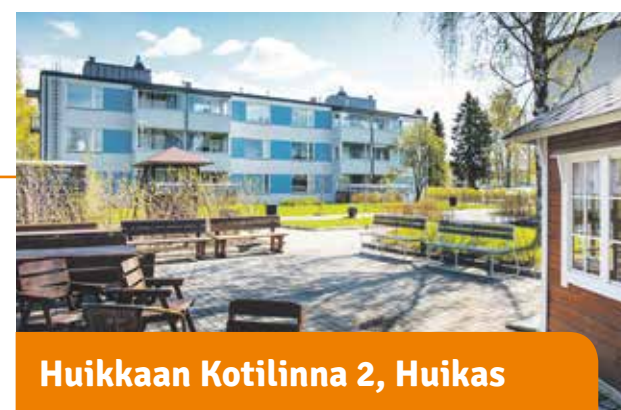
Huikkaan Kotilinnat 2, Huikas

Nopeasti keskustaan. Heti talon edessä on bussipysäkki, josta pääset kätevästi onnikan kyytiin. Jokaisessa asunnossa on terassipiha tai lasitettu parveke.