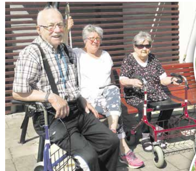
Pappilanpuiston Kotilinnan asukkaita pihakonsertissa.

Vellamonkodit kutsuu pihatapahtumiinsa mukaan myös muiden Tammelalan alueen Kotilainnojen asukkaita.