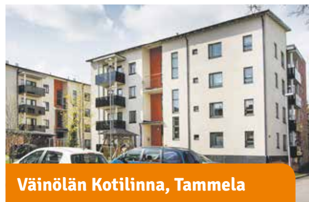
Väinölän Kotilinnat, Tammela

Keskusta-asumista. Suositun Sorsapuiston kauneus ja Tampere-talon kulttuuritarjonta ovat ihan lähellä. Talon joka kerroksessa on yhteinen suuri parveke.