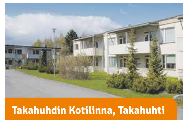
Takahuhdin Kotilinnat, Takahuhti

Idyllinen Pappila. Kävelymatkan päässä Alasjärven uimarannasta ja ulkoilumaastoista. Vuonna 2012 valmistuneissa asunnoissa on omat lasitetut parvekkeet. Talossa toimii myös Pappilanpuiston palvelukeskus ja Tampereen Voimian ravintola.